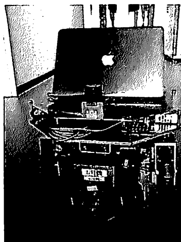
Fig.1 Overview of the omni-directional mobile robot ZEN (W430×D430×H335 (mm); 200 (mm/s))

通路環境において、ロボットの位置や動作が人間の歩行動作にどのような影響を与えるかを調べるため、3自由度独立駆動型全方向移動ロボット (ZEN[5], 図 1) を用いて、図 2 に示すような環境で実験を行った。実験には 20 代男性 4 名が参加した。