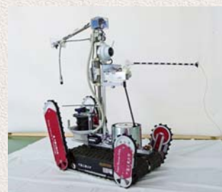
写真-2)福島で活躍するロボット：クインス

きなかったのですが、いまや30種類以上の日本のロボットが、福島の原子力発電所の中で大きな貢献を果たしています。それを見ても、日本のロボット技術は大変高度なものであることが証明できたと思います。