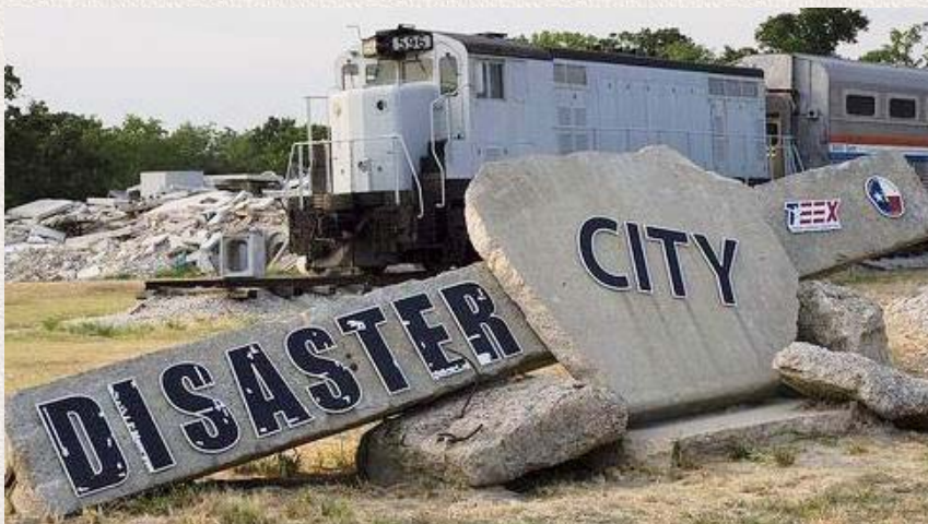
写真-3)テキサス州にあるDISASTER CITY 写真は、列車の脱線事故を再現している現場である。

アメリカでは、軍事予算を使って災害対応や偵察、爆弾処理等の様々なロボットを開発しています。そして開発したロボットは、このDISASTER CITYに持ち込んでテストを受けるわけです。さらに、アメリカにはNIST（アメリカ国立標準技術研究所）という組織がありまして、そこが各種ロボットに関する評価方法の標準化を行っています。